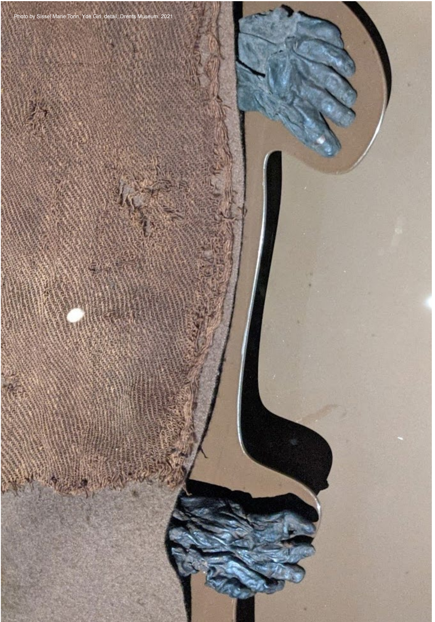
Yde Girl, detail, Drents Museum. 2021